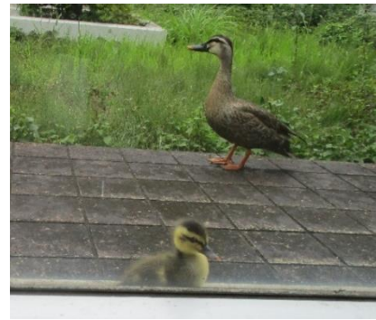
写真：国立病院機構宇都宮病院外来棟中庭

実施できる技術の幅が広がることで、「床ずれ」の治癒を早めることができるようになります。